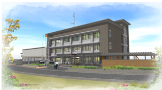
琴浦大山警察署 イメージ図

琴浦大山警察署は、山陰道琴浦船上山インターチェンジの北側、JR赤碓駅の南西（旧赤碓選果場跡）に位置しています。皆さんにより親しんでいただけるよう頑張っています。