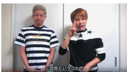
応援メッセージ HAND SIGN