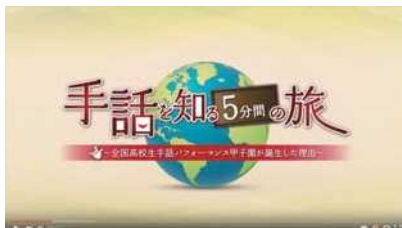
大会プロモーション映像 「手話を知る5分間の旅篇」