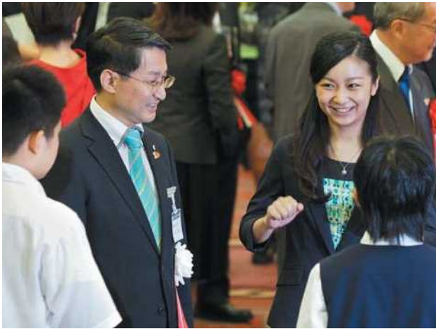
交流会に御臨席になる佳子内親王殿下。