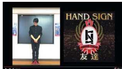
第2回大会公式テーマソング HANDSIGN『友達』(手話ver.)