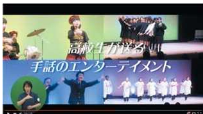
大会プロモーション映像「開催篇」