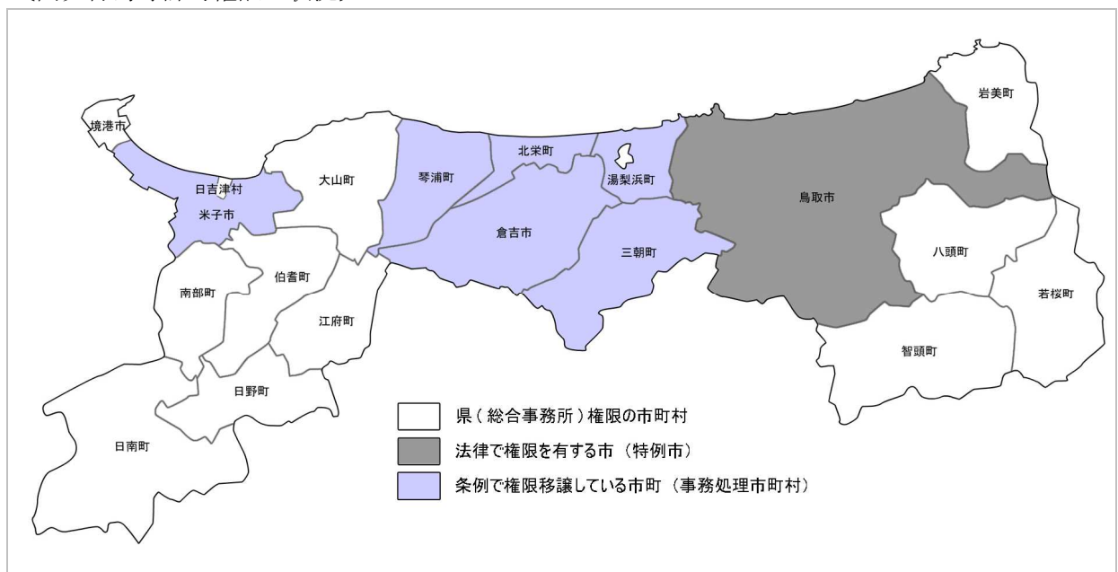
〔開発行為等許可権限の状況〕