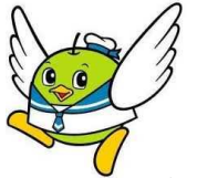
鳥取県マスコットキャラクター「トリピー」

「鳥取県技術人材バンク」は、専任のコーディネーターが、技術的・専門的職業への就職を希望する方と技術的・専門的人材を求める鳥取県内企業とのマッチングを支援する鳥取県が行う無料の職業紹介事業です。