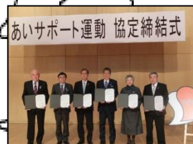
秩父市・横瀬町・皆野町 長瀬町・小鹿野町 (H27.11.6)