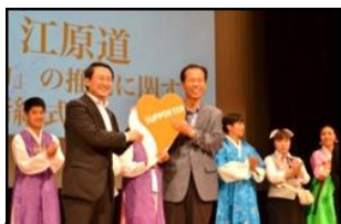
【初の海外進出】 韓国江原道 (H26.10.4)

あいサポーター数: 403,453人 / あいサポーター研修実施回数: 4,957回 あいサポート企業・団体認定数: 1,518企業・団体 (平成29年12月末現在)