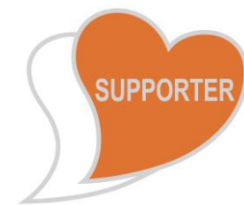
あいサポートバッジ

バッジのデザインは、障がいのある方を支える「心」を2つのハートを重ねることで表現しています。