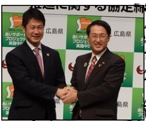
広島県 (H23.12.11) 182,151人