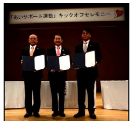
富士見市・三芳町 (H26.10.16) 6,387人 埼玉県