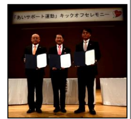
富士見市・三芳町 (H26.10.16) 5,395人