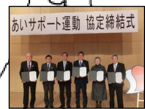
秩父市・横瀬町・皆野町 長瀬町・小鹿野町 (H27.11.6)