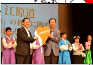
【初の海外進出】 韓国江原道 (H26.10.4)