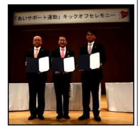
富士見市・三芳町 (H26.10.16) 5,170人