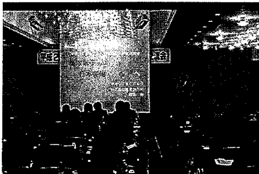
（鳥取県への進出企業による事例発表）