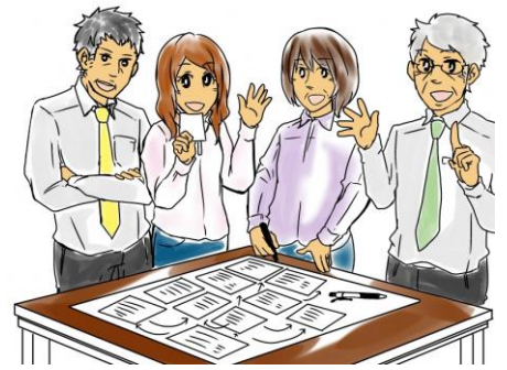
【鳥取県が作成したカイゼンマンガの 一コマ】