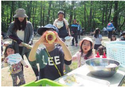
何が見えるかな (春の体験満開フェスティバルより)

大山青年の家は、人と自然が出会う場所。 さらには、その出会いをとおして、新しい自分に出会える場所です。