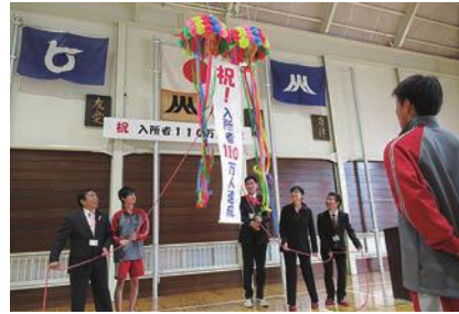
入所者 110 万人記念式典 (平成 30 年 4 月 23 日 米子北高等学校)