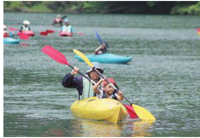
息を合わせてパドリング