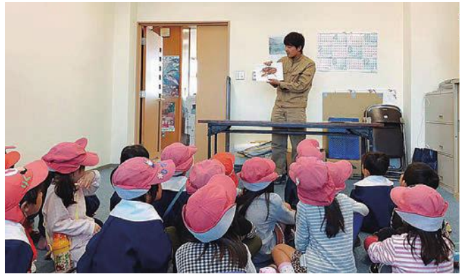
赤碓こども園でのトーク会