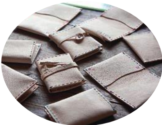
素敵な名刺入れが完成！！