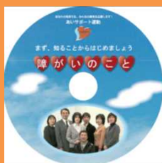
様々な障がいの 特性や配慮方法 を紹介したDVD