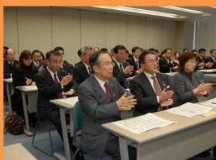
あいサポーター研修を 受けている様子