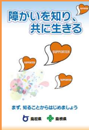
様々な障がいの特性や配慮方法を 紹介したミニパンフレット