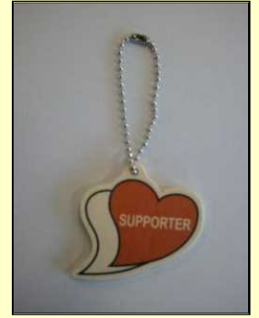
学習してもらえらるストラップ

学校の授業で「あいサポート運動」や「障がい理解（手話学習や体験学習など）」の学習などに取り組んだ後、報告書を送っていただくと、学習に取り組んだ子どもたち全員に、「あいサポートストラップ」を差し上げます。