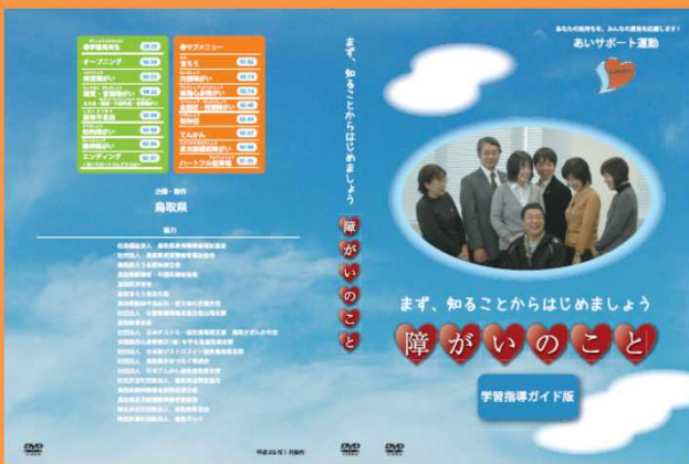
「障がいのある方等が出演し直接語りかけているDVD」

あいサポート運動に関するゲストティーチャーの派遣や福祉学習、教職員・保護者向けのあいサポーター研修などの御相談は、鳥取県社会福祉協議会福祉振興部にお問合せください。