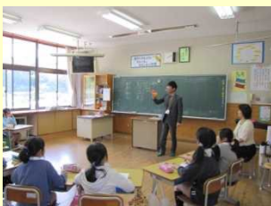
「あいサポートマインド」を胸に！

県社協職員からあいサポート運動の名前やマークの意味について、そこに込められた思いなどをふまえて説明をし、障がいのある人もそうでない人も、みんなで共に生きようとする「あいサポートマインド」を持って行動しましょうと伝えました。