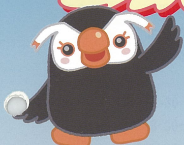
北方領土イメージキャラクター 「エリカちゃん」