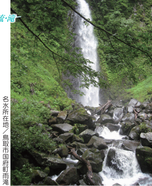
名水所在地／鳥取市国府町雨滝