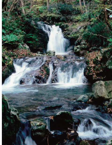
名水所在地／八頭郡智頭町芦津