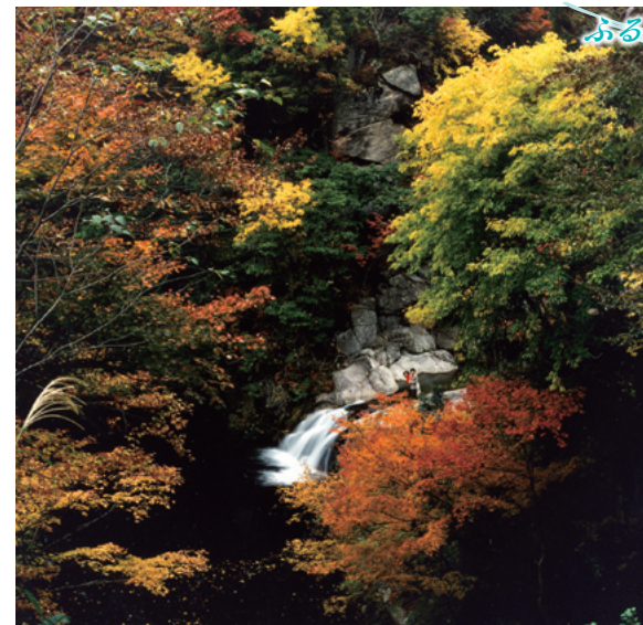
昭和60年6月選定 名水所在地／東伯郡三朝町大字神倉・中津

鳥取市 生活環境課 郵便番号：680-8571 住所：鳥取市尚徳町116番地 電話番号：0857-20-3216