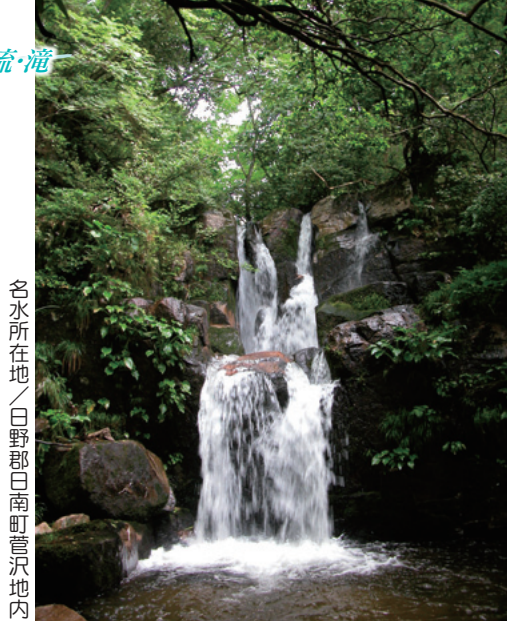
名水所在地／日野郡日南町菅沢地内