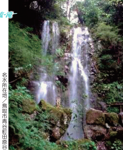
名水所在地／鳥取市青谷町田原合