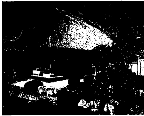
松甫園から主屋を見る