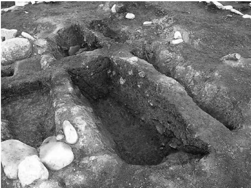
2 2号墓埋葬施設3 長軸土層断面(南東から)