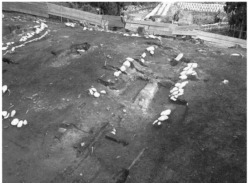
2 4号墓区画溝北辺完掘、 3号墓南辺礫検出状況(南西から)