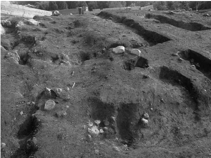
2 3号墓区画溝北西隅 完掘状況(北西から)