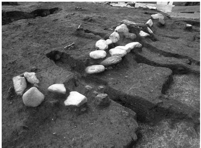
3 3号墓南辺 礫検出状況(南西から)