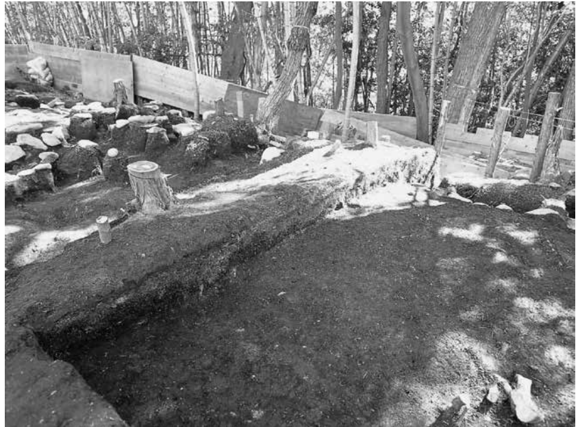
1 3号墓東辺付近 堆積状況(南西から)