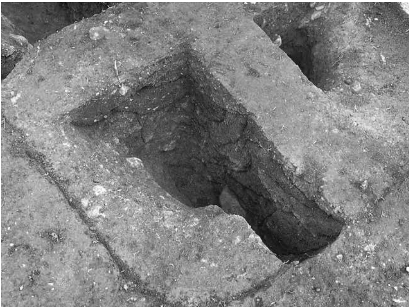
2 3号墓埋葬施設 長軸土層断面(北西から)