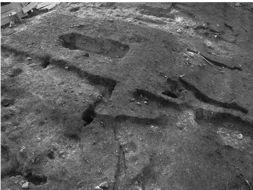
3 3号墓北西隅 完掘状況(北西から)