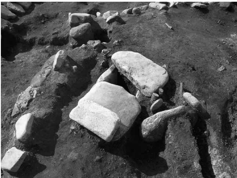
2 2号墓埋葬施設4 検出状況(東から)