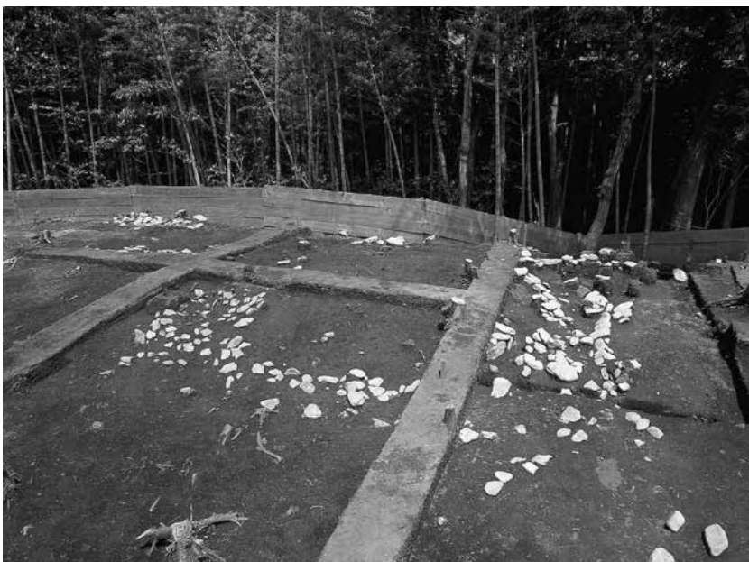
3 2号墓検出状況 (南西から)