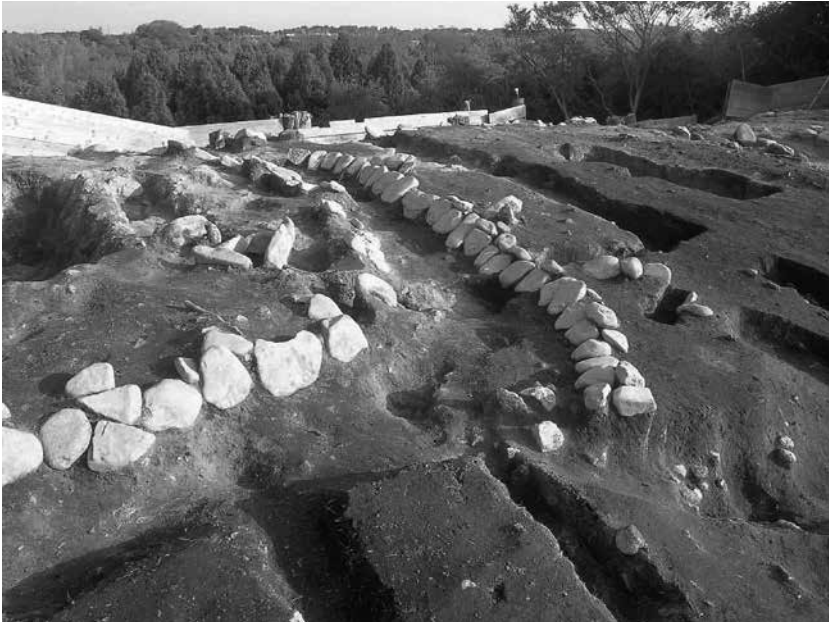
1 3号墓北辺 貼石検出状況(北西から)