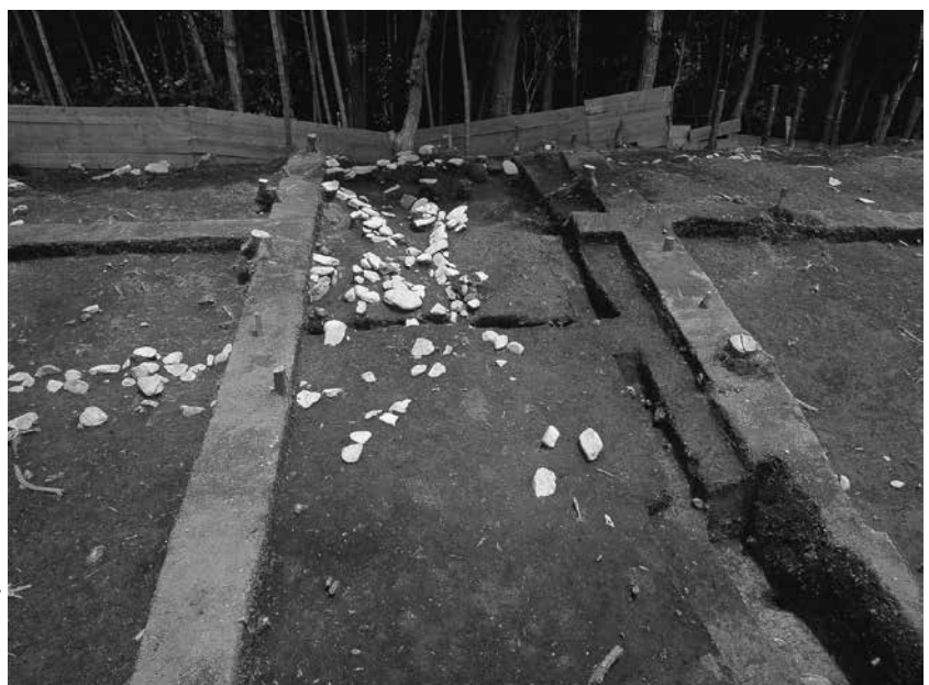
3 2号墓南辺、3号墓北辺 区画溝検出状況(西から)