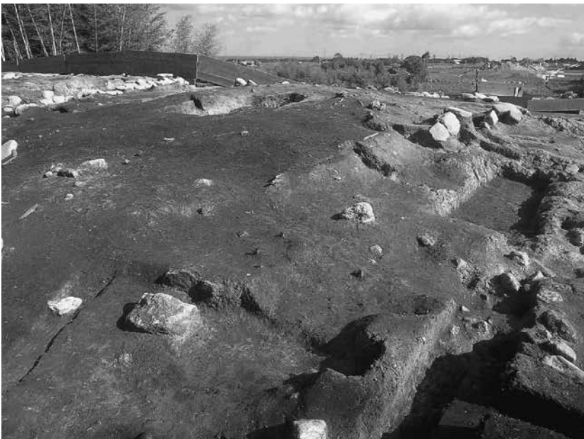
3 3号墓南西隅及び南辺 貼石検出状況(南西から)