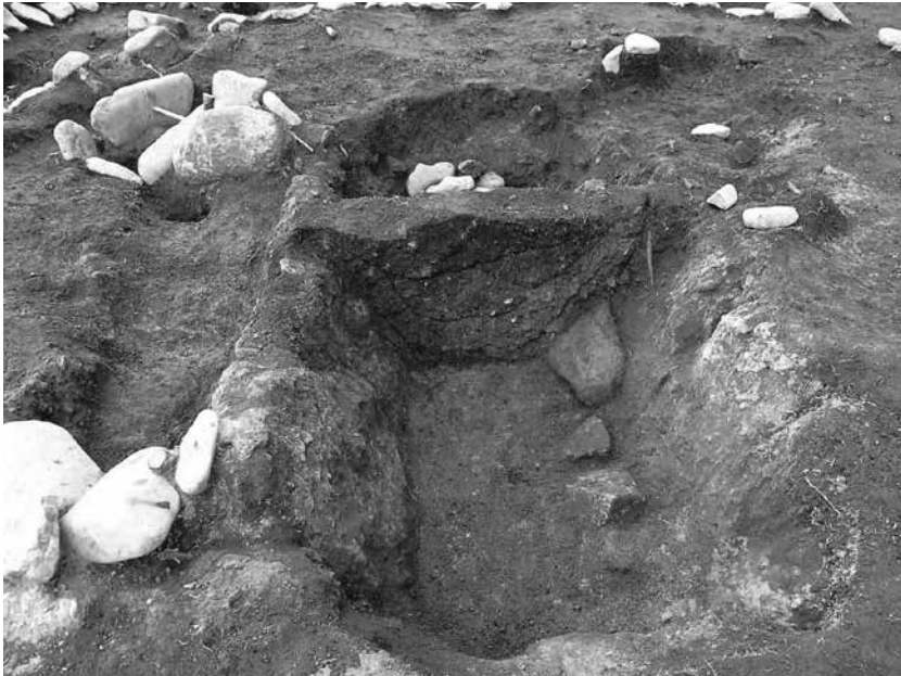
1 2号墓埋葬施設3 短軸土層断面(東から)