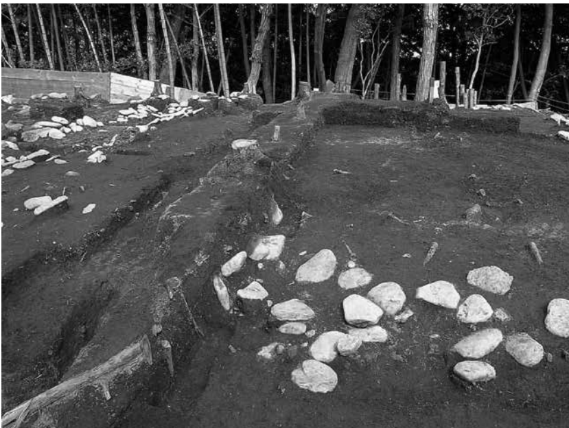
3 3号墓区画溝西辺 土層断面(南西から)