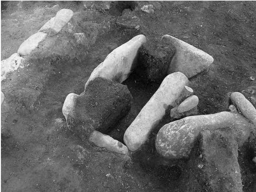
1 2号墓埋葬施設4 棺内土層断面(東から)