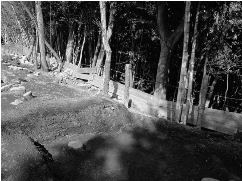
2 4号墓区画溝東辺 土層断面(南西から)