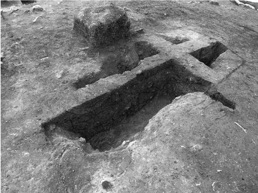
1 3号墓埋葬施設 長軸土層断面(北東から)