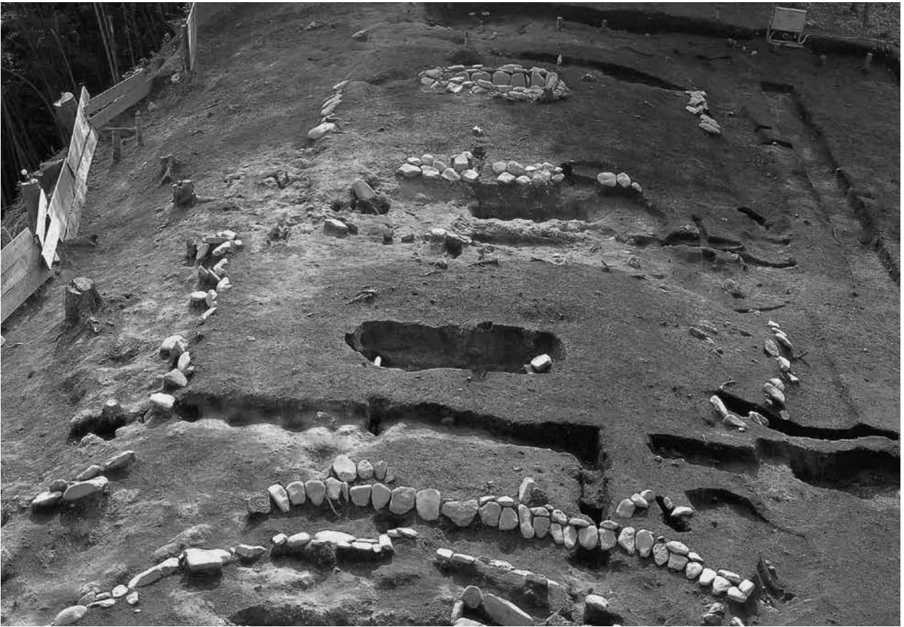
1 3号墓・4号墓(北から)