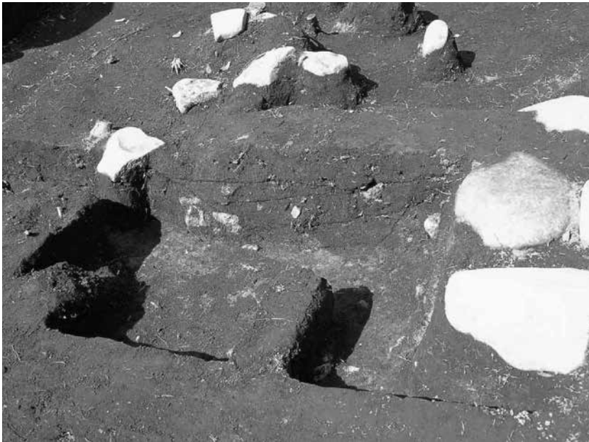
1 4号墓区画溝西辺 土層断面(南から)