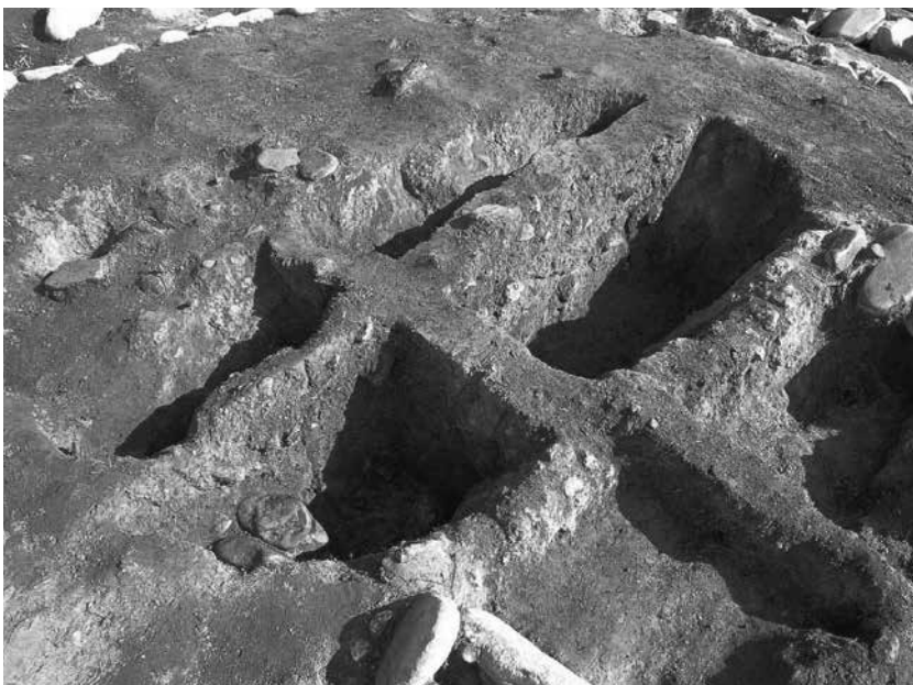
3 2号墓埋葬施設3 長軸土層断面(南西から)