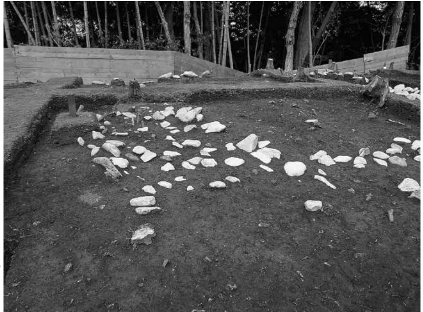
1 1号墓南辺、2号墓北・西辺 区画溝検出状況(西から)