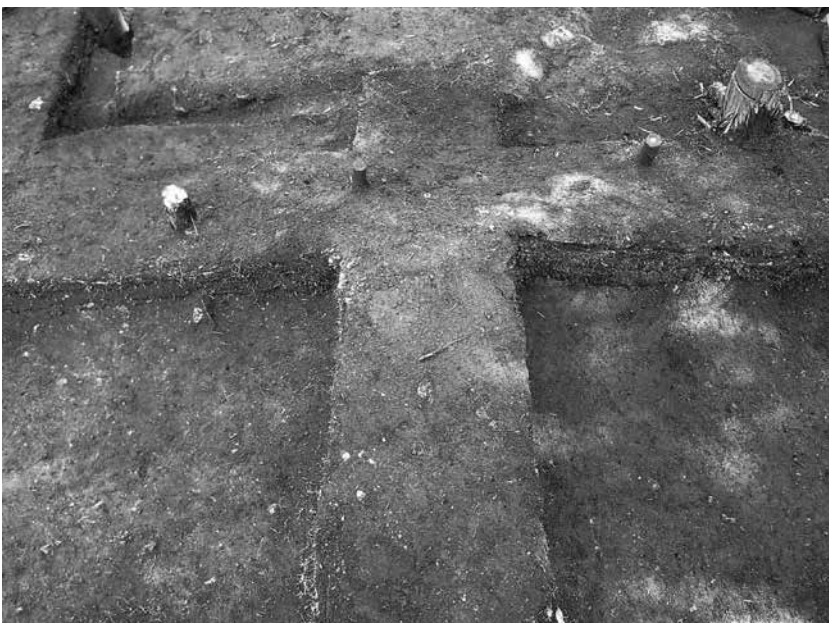
3 3号墓埋葬施設 検出状況(南から)