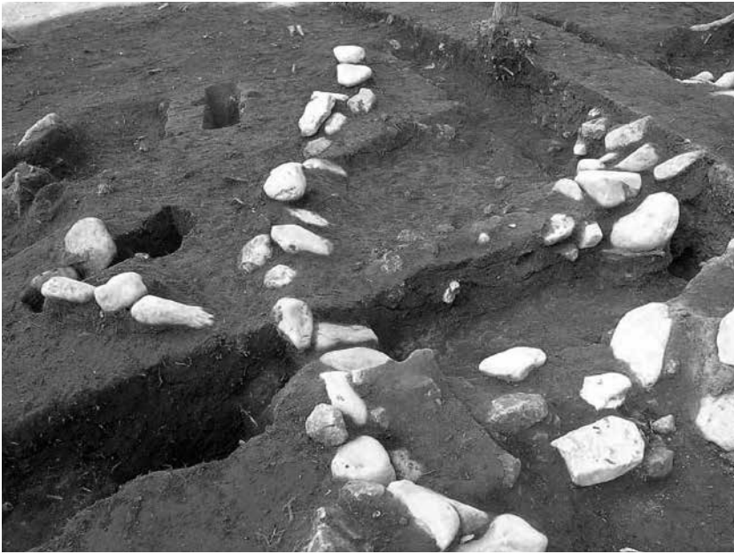
1 2号墓南西辺、3号墓北東隅 区画溝等土層断面(南東から)