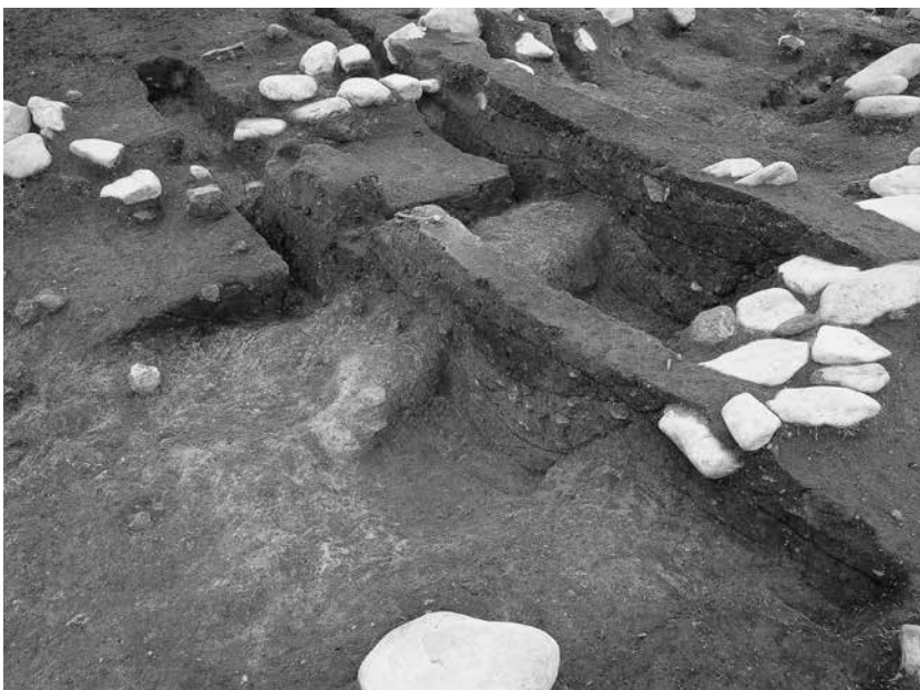
3 4号墓北辺、3号墓南辺 区画溝土層断面(南西から)