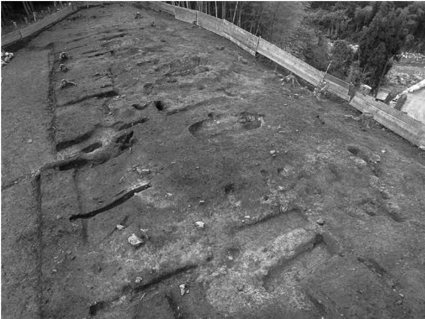
1 3号墓完掘状況 (南西から)