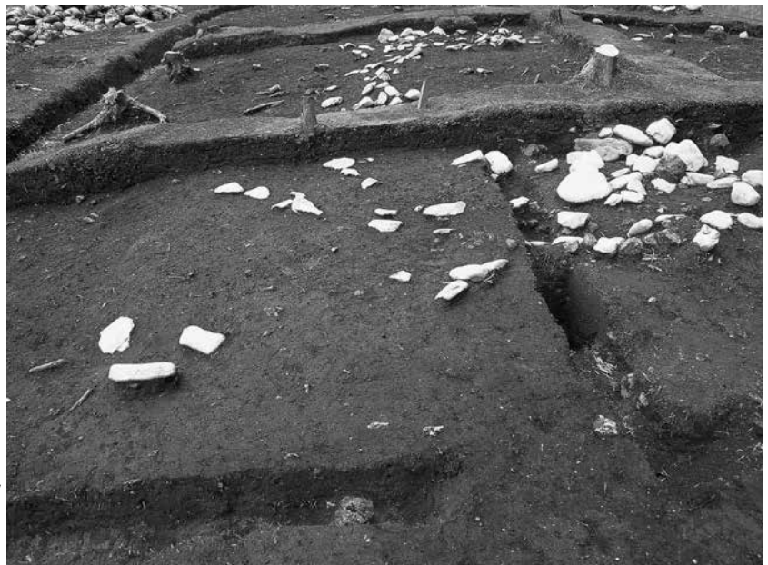
2 2号墓南西辺、3号墓北西辺 区画溝検出状況(南から)