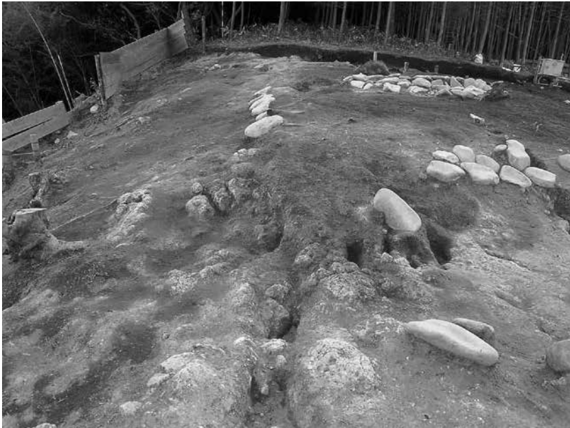
1 4号墓北東隅及び東辺 貼石検出状況(北から)