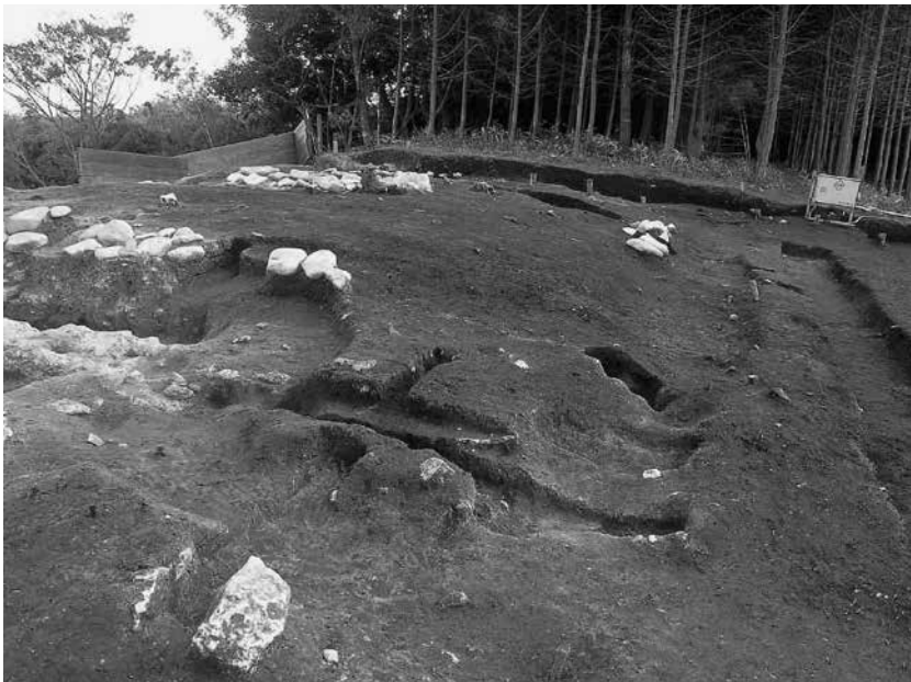
2 4号墓区画溝北西隅及び西辺 完掘状況(北西から)