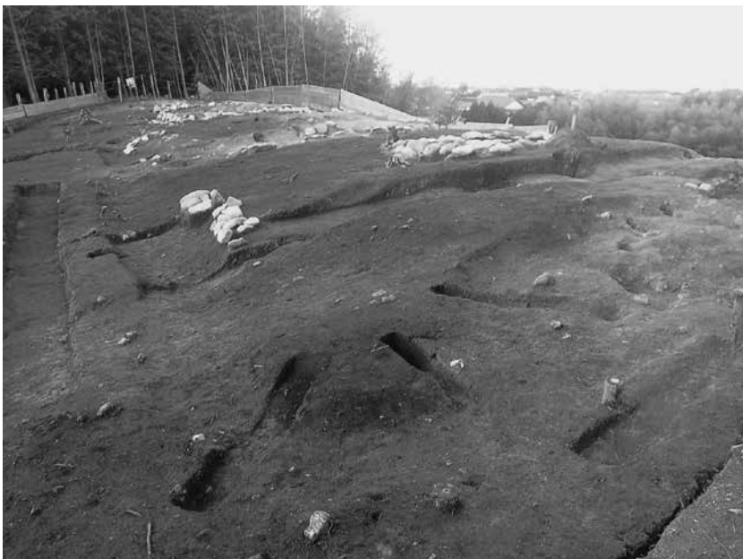
3 4号墓区画溝南西隅 完掘状況(南西から)