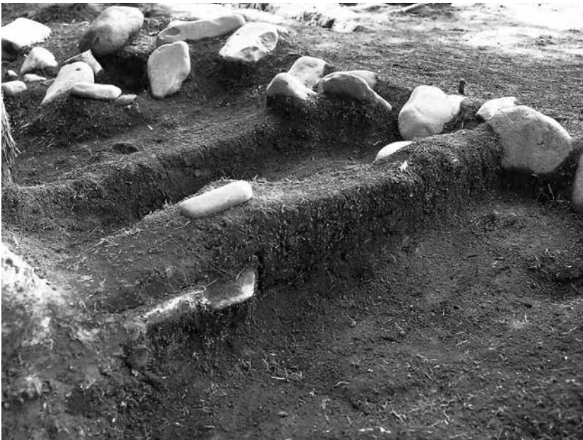
2 3号墓区画溝東辺 土層断面(北から)