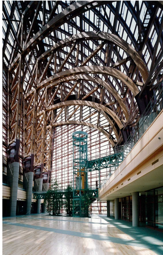
倉吉未来中心（倉吉市）

アトリウムの大断面集成材の一部に県産材（大山赤松）を使用。暖かみと迫力ある大空間を演出した事例。