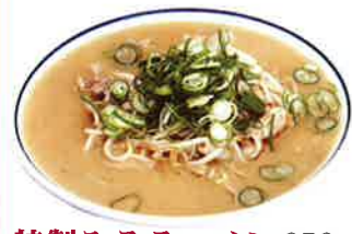
特製みそラーメン 650円