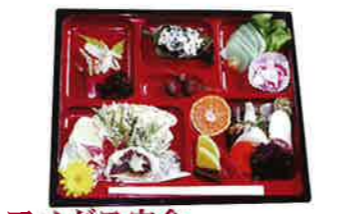
アメダス定食 (要予約) 1,400円

地元産山菜を主材料にした天ぷら、煮付け、その他の野菜料理に、地元産コシヒカリと地元産そばを味わっていただける築陽風定食です。