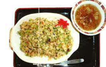
ねぎちゃんぱん 700円