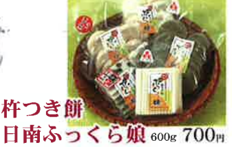
杵つき餅 600g 700円

☎ 4月~6月、10月~11月は毎週火曜日 (観光農園開演中は無休) ☎ 10:00~17:00