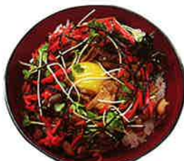
鶏シメジてりやき丼 700円