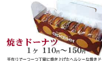
焼きドーナツ 1ヶ 110円~150円

手作りで一つ一つ丁寧に焼き上げたヘルシーな焼きドーナツ。ブルーベリー、ココア、抹茶、ごま、クルミ、プレーン等、色々な味が楽しめます。雄大な景色と小さなギャラリーで癒しの空間をお過ごしください。