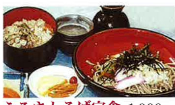
ふるさとそば定食 1,000円

そば粉100%で仕上げた麺。つゆは、花かつおと昆布でダシを取り、山芋とろろをかけて食べる。温かいのもできます。