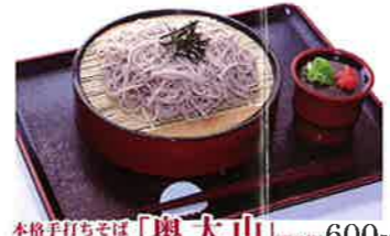
本格手打ちそば「 奥大山 」(要予約) 600円

奥大山の鶴屋でおいしい水で育まれた地元江府町産のそば粉を使用したこだわりの手打ちそばです。注文数だけ打つので前日までにご予約を。