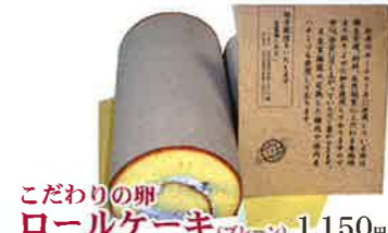
こだわりの卵 ロールケーキ (フレッシュ) 1,150円

飼料、衛生管理にこだわった養鶏場からとり寄せた卵。自家梅園の完熟した梅肉や、国産八チミツ、てんさいがんと蜜糖など安全、安心に召し上がっていただけるお菓子です。