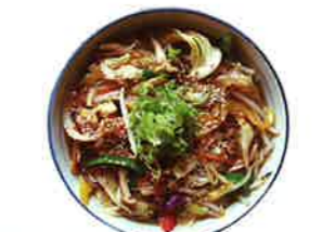
おしどりラーメン 630円

日野川におしどりが来る11月~3月までの限定ラーメンです。おしどりの色に合わせ緑黄色野菜を使った野菜たっぷりラーメンです。