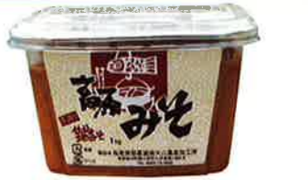
奥大山高原みそ 1kg 600円

この地域に伝わる伝統的な保存食をさらにおいしくいただける様、やわらかく仕上げました。絶妙な塩加減の熟成した鳥取牛一夜干しを、お酒のお供にまた、おかずの一品にいかがでしょうか。