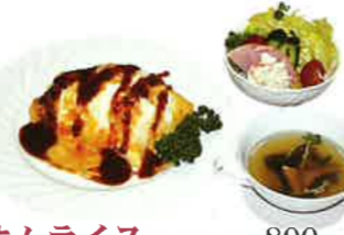
オムライス (サラダ、スープ付) 800円