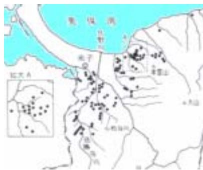
前方後円墳の位置