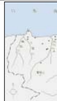
前方後円墳の位置