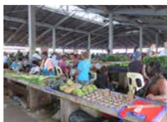
セントラルマーケット 首都で一番大きな市場。みな ご飯の食材はほぼここで調 達します。