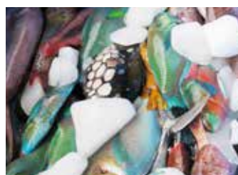
マーケットの魚たち カラフルな熱帯魚。もちろん 全部食用です！