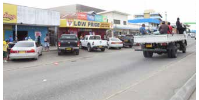
首都ホニアラ 高い建物はほとんどなく、中国人経営の店やレストラ ンがたくさんあります。主要道路が一つのため、渋滞は 毎日。乗車中に歩く人々に越されることは日常茶飯事。