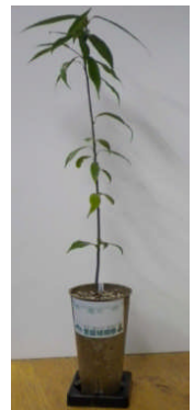
苗木配布イメージ