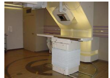
（写真）兵庫県立粒子線医療センター