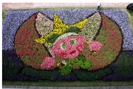
第26回 おかやまフェア(H21)