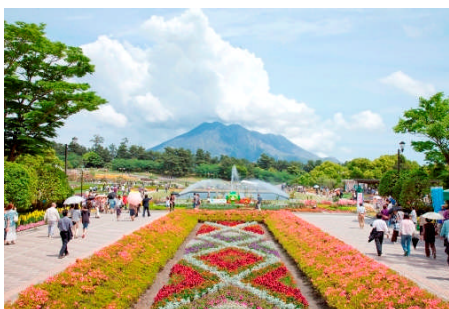
第28回 かがしまフェア(H23)

昭和 58 年から地方公共団体と財団法人都市緑化機構との共催で各地を巡りながら開催し、本県で平成 25 年度に開催