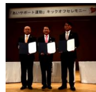
埼玉県富士見市及び 三芳町(H26.10.16)