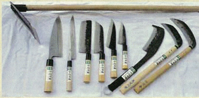
中島刃物製作所の製品。鋏、各種包丁、鉈、鎌、切れ味は折り紙つき