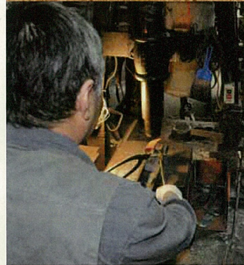
鎌の刃を鍛える作業 中島刃物製作所

鳥取県でも、包丁や鋏、鎌などの鉄製道具や農具を手仕事で作る、昔ながらの鍛冶屋は数少なくなりました。今回は、その技術を今でも継承している伝統工芸士を紹介します。