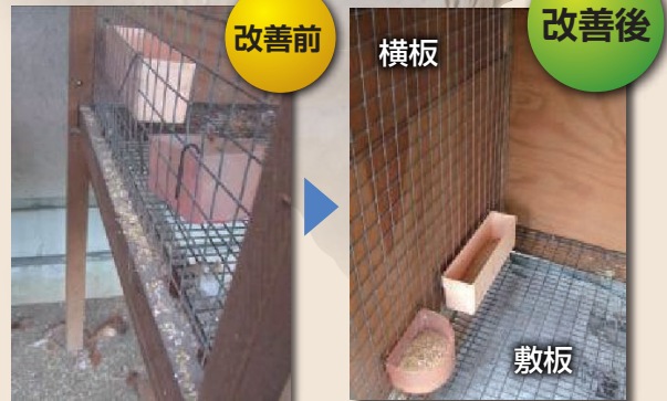
写真3 板を使った餌の散乱防止