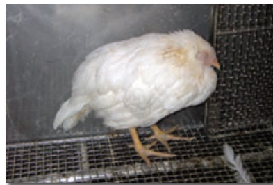
写真2 感染し、元気をなくした鶏