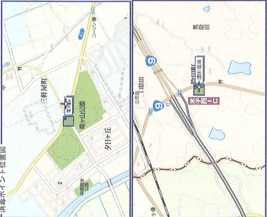
消毒ポイント位置図