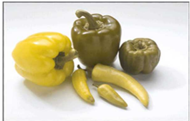
色弱者（P型）シミュレーション