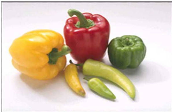
一般色覚者の見え方

色覚の差が情報の差にならないよう誰に対してもきちんと正しい情報が伝わるように、色の使い方などにあらかじめ配慮することを、カラーユニバサルデザイン（カラーUD）といいます。