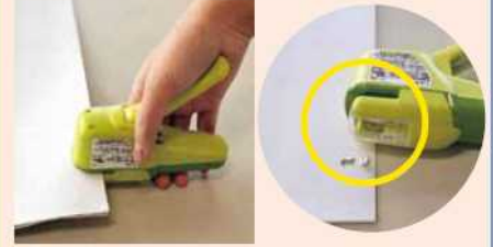
針なしステープラー