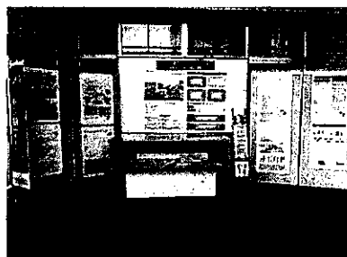
パネル展示 (1階エントランス)