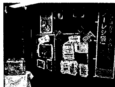
手作りマイバック活動 (展望室)