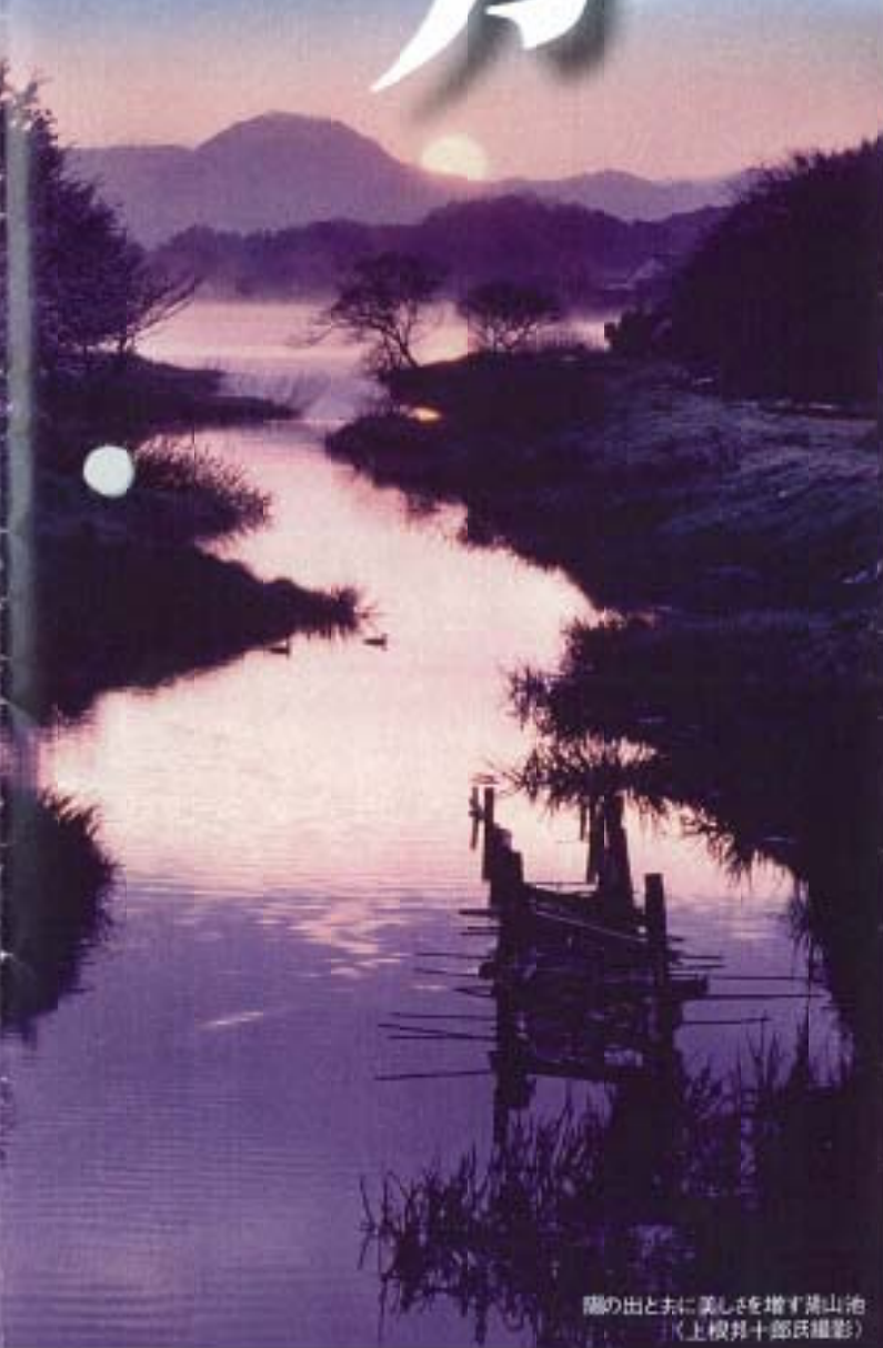
湖の出と去に美しさを増す湖山池