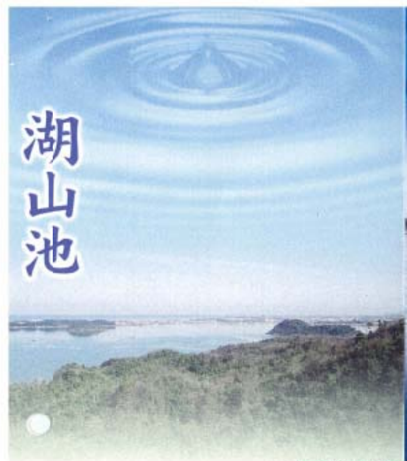
松原高原より望む