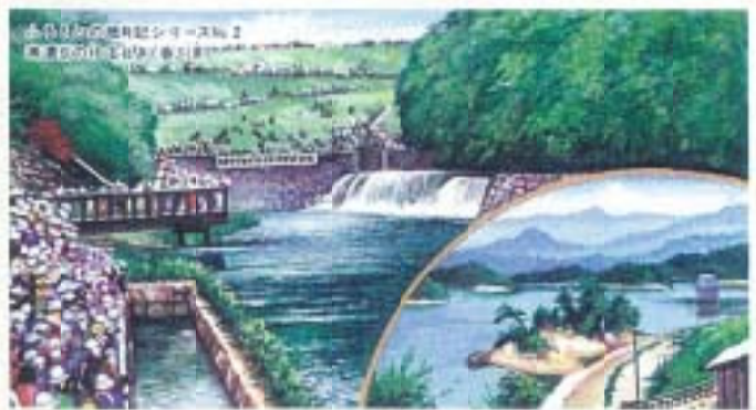
多くの観光客が訪れる池として整備されている。