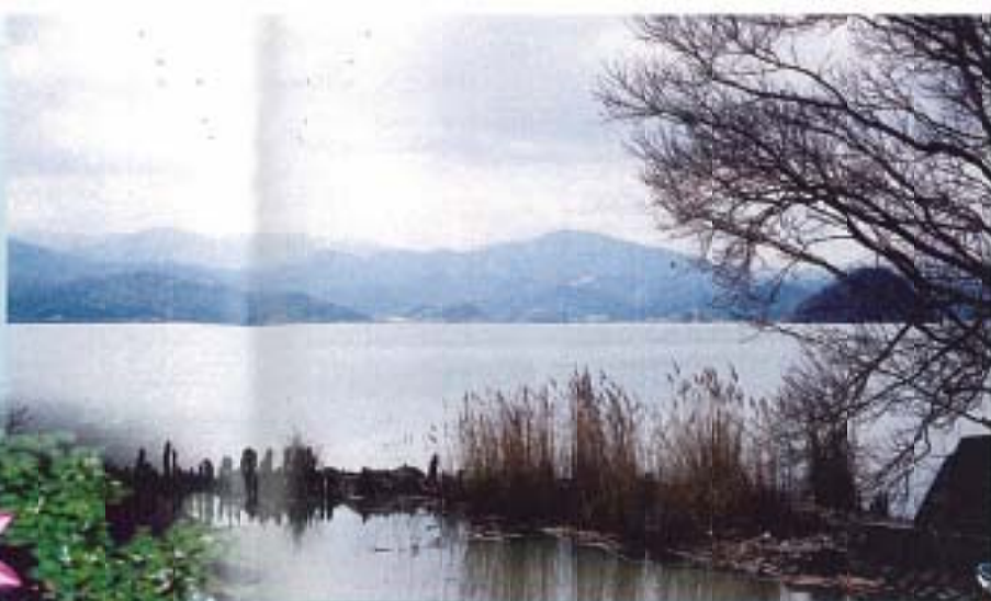
※窓からの風景 日本一広い庭園

古来から毎日見なれた湖山池、 ちなみに東西南北少しずつ歩いてみると、こんなに違うものと驚かされます。 今では矢山スカイパーク、松原高原など高い視線から見つめると、 こんなに違った風景が味わえます。