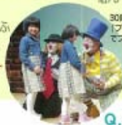
30周年記念作品「フレンジャー・Bサーカス」でプレゼントを頂きました

Q 3才の子が最後まで情がったり、うるさくして席の迷惑にならないでお芝居を観ることができるか心配です。