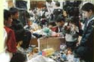
子どもフリーマーケットで小売女店長さん賞 「オペラとんくりに山ねこ」ワークショップ 日時: 2016年 2月 18日 15:00~16:00

おやこまつり・料理教室・手作りの会など、楽しい会を行っています。子どもたちはもちろん、お母さん・お父さん同士もこの活動を通じて交流を深めています。