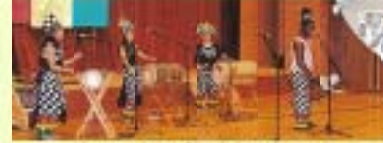
ピアノの演奏と踊り「ドットゥンバ」