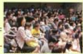
ワクワクが止まりません! 親子一緒に観劇

NPO法人子ども未来ネットワークと共催。メディアスタート・トイスタート・アートスタートに取り組んでいます。