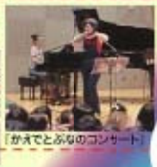
「かえとぶなのコンサート」