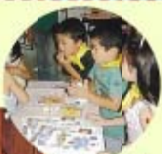
例会の受付に挑戦! 「いっしょにいっせ」

舞台劇・人形劇・音楽・ミュージカル・オペラ・伝統芸能など、会員が意見を出し合って選んだ舞台を鑑賞します。舞台の企画・運営も会員が行います。そして舞台のお手伝いをしながら出演者とふれあえるのも、「おや子劇場」の魅力のひとつです。