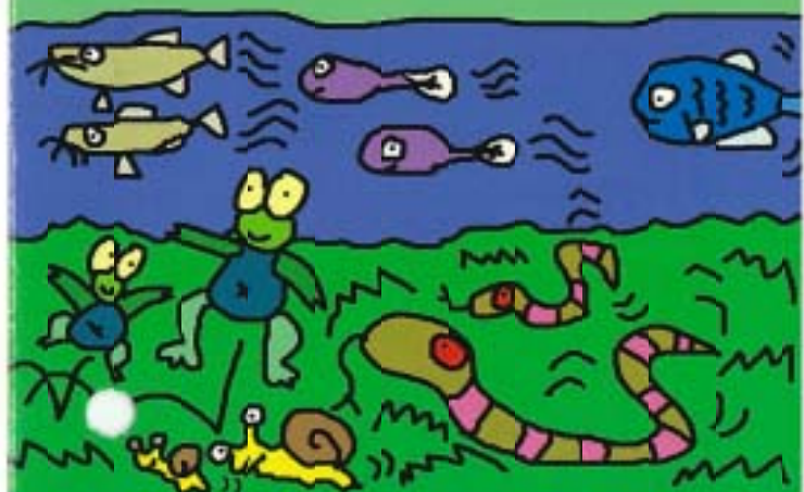
イラスト:山崎貴文くん