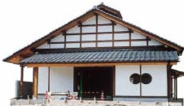
喫茶「清流の里 新田」

智頭町新田は、きれいな空気と水と緑に恵まれた高原にあります。ここ新田にはゆったりとした時間が流れています。時の過ぎ行くままに、中国山地の山ふところに抱かれて、小鳥の歌を聴きながら、心地よい風に吹かれていると人生の至福を感じずにはられません。清涼の山里の自然に囲まれて、自由気ままに土に親しむ、そんなカントリーライフを楽しんでみませんか。