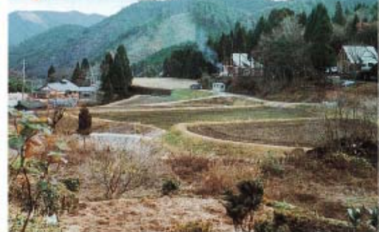
農園付ペンション「とんぼの見える家」