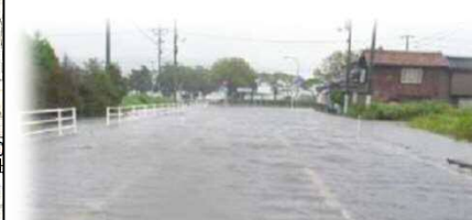
平成23年台風12号による道路冠水状況 東郷湖線(上浅津)