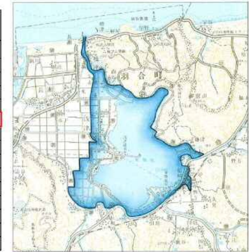
昭和62年10月16、17日台風19号による氾濫区域