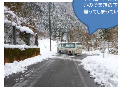
すれ違いが出来ないので集落の下で帰ってしまっている