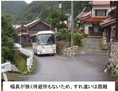
幅員が狭く待避所もないため、すれ違いは困難