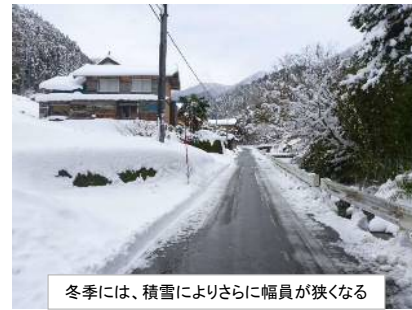
冬季には、積雪によりさらに幅員が狭くなる