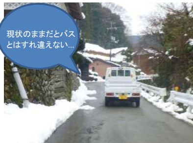
現状のままだとバスとはすれ違えない...