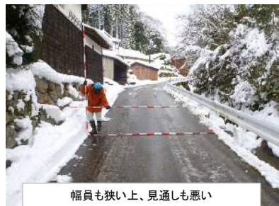
幅員も狭い上、見通しも悪い