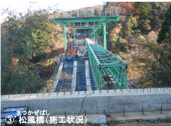
まつかぜばし ③松風橋(施工状況)