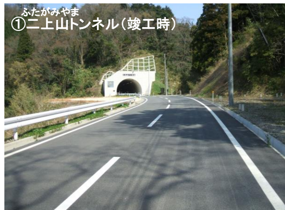
ふたがみやま ①二上山トンネル(竣工時)