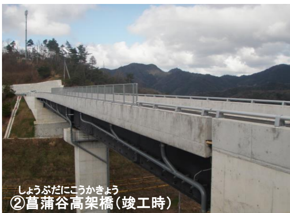
しょうぶだにこうかきょう ②菖蒲谷高架橋(竣工時)