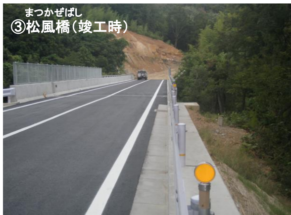
まつかぜばし ③松風橋(竣工時)