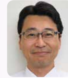
鳥取県教育委員会 教育長 山本仁志