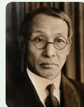
永井幸次 1874~1965:鳥取市出身

主な作品等 「五ーじいさん」、「ささ 船」など。大阪音楽学校 の設立に大きく貢献。