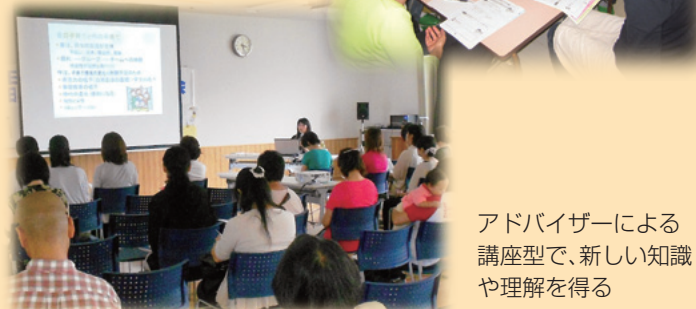
アドバイザーによる講座型で、新しい知識や理解を得る