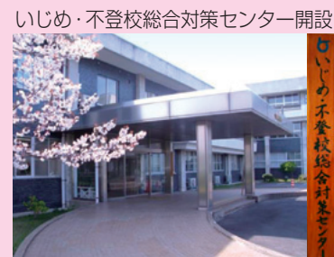
いじめ・不登校総合対策センター開設

また、学校や教育関係者、家庭・地域と一緒に、いじめの問題を考えるシンポジウムの開催も予定しています。