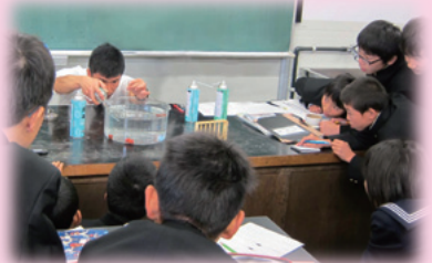
中学校理科の授業「いろいろな気体とその性質」

理科の観察・実験の基礎的指導技術習得を希望する小学校に、教育センターの指導主事等が出前講座に出かけます。