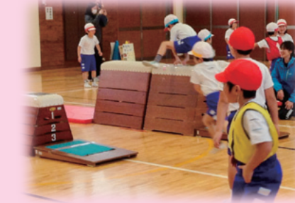
体育学習の様子 南部町立会見小学校

各学校が子どもたちの実態を踏まえた体力向上推進計画を策定、実践、評価、改善する仕組みをつくることによって、体力・運動能力の向上を図ります。また、モデル校・地域を指定して、学校と地域が連携しながら子どもたちの体力向上を目指す先進的な取組を行います。