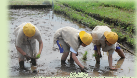
古代の衣装(貫頭衣)を着て古代米の田植え体験(青谷上寺地遺跡)

親子で楽しめる火起こしや勾玉作り、古代米の田植え・稲刈り体験の開催、学校や地域へ向けて郷土の文化遺産の魅力を紹介する出前講座、大人も子どもも鳥取の文化財を調べることができるデータベースの公開など、郷土の文化遺産やその情報に触れる機会を増やし、知的好奇心を喚起します。