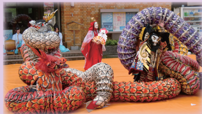
郷土芸能部による荒神神楽の奉納

日野高等学校において、特色や魅力ある学校づくりを進めるため、学校と地域が連携しながら高校の活性化を図るための取組を行います。