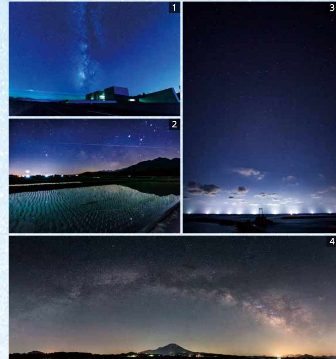
撮影場所: 1 伯耆町 2 大山町 3 湯梨浜町 ※1~3は星取県フォトコンテスト優秀作品