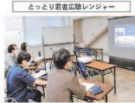
オンラインで活動内容を聞く部員

鳥取県は、若者の市政参画を促すため、本年度、「とっとり若者広聴レンジャー」に鳥取東高の生徒4人組と鳥取大の学生4人組の2チーム、計8人を任命した。県政の課題の解決につながる政策を提案しようと、それぞれがテーマを持って、地域に向き、取材、調査活動に取り組んでいる。各チームが目指す方向性と、これまでの活動を紹介する。