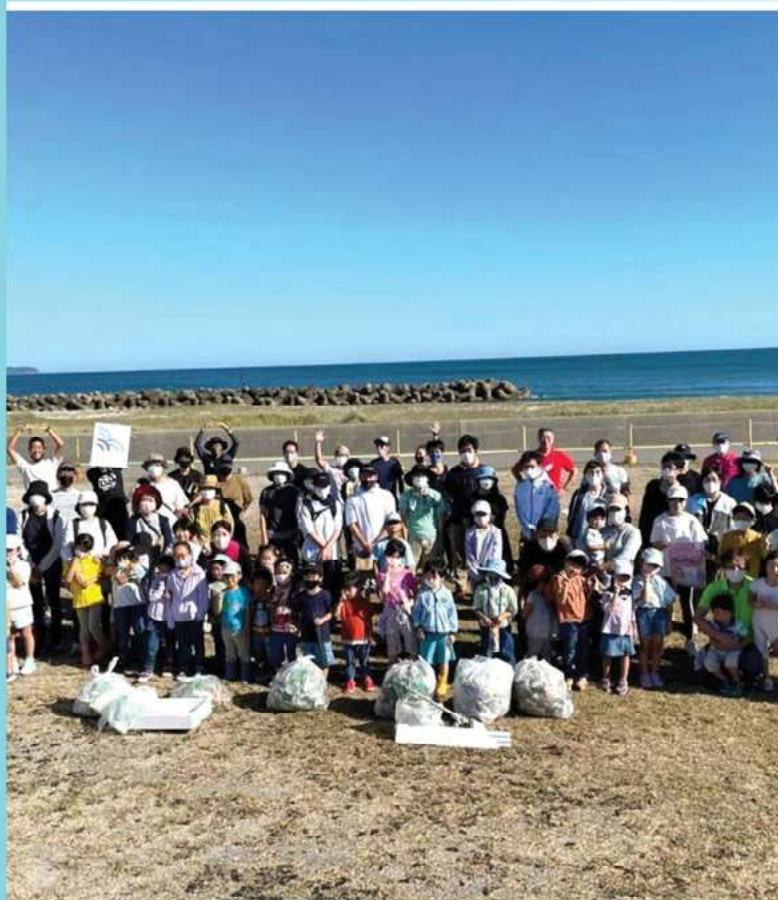
多様な関係者との協働