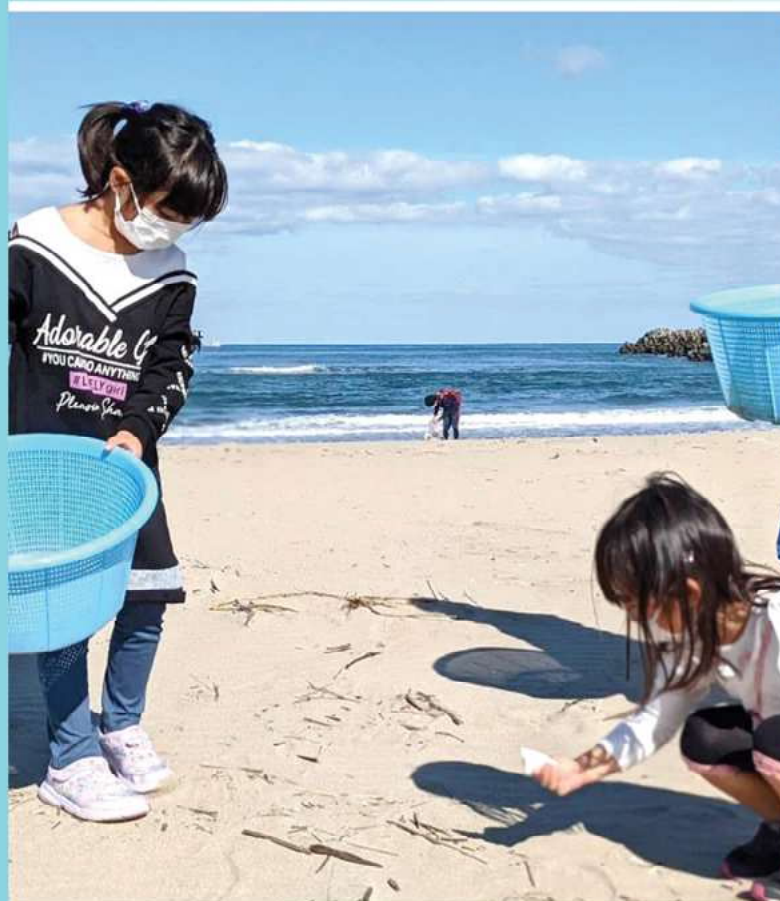
鳥取の海岸の現状