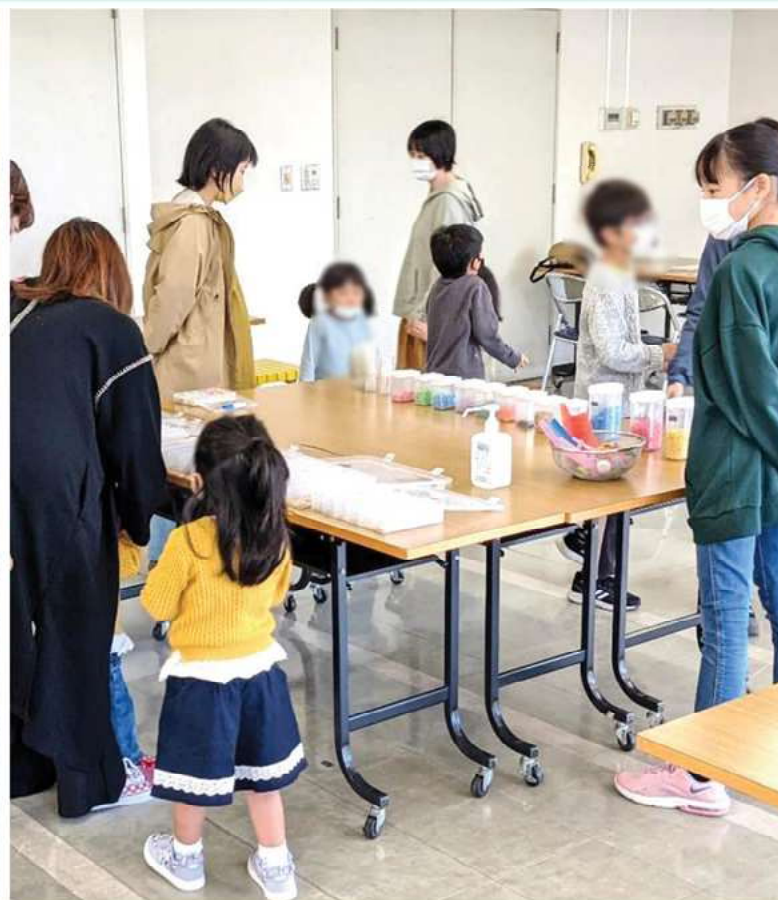
海エコクラブの結成