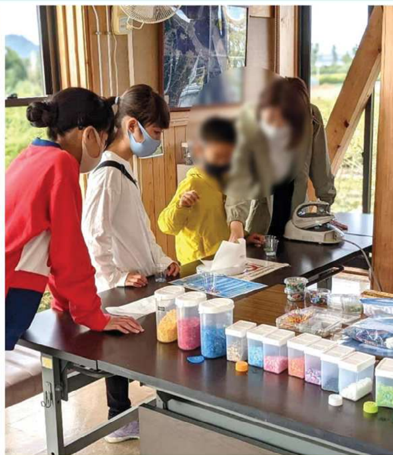
SDGs導入の教育的効果