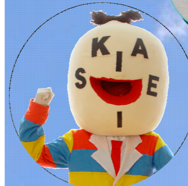
皆成学園 マスコットキャラクター かいせい たろう