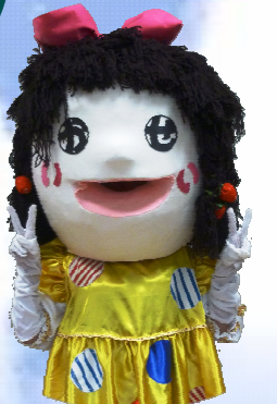
皆成学園 マスコットキャラクター かいせい はなこ