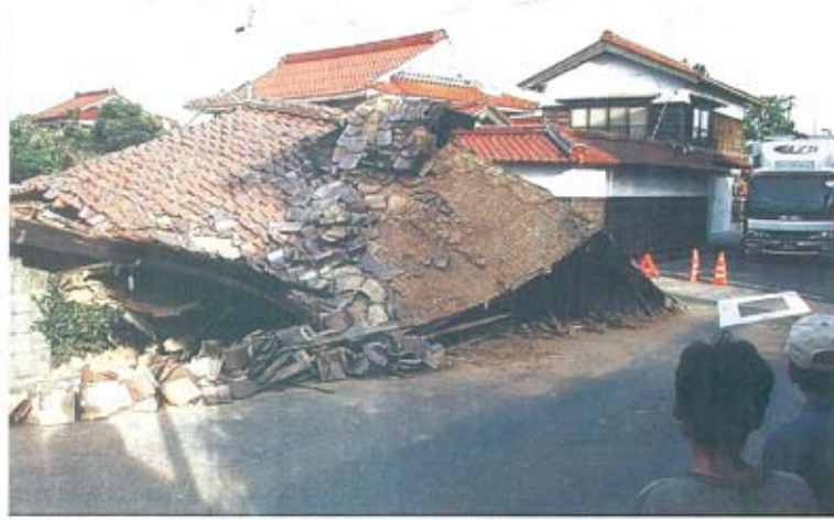
家は半壊も崩れ落ちた民家—6日午後3時すぎ、鳥取県米子市和歌町

被災者は、大震災被災者「またか」と感じている。神戸に避難し、米子へ第1陣が到着した。被災者は、大震災被災者「またか」と感じている。神戸に避難し、米子へ第1陣が到着した。