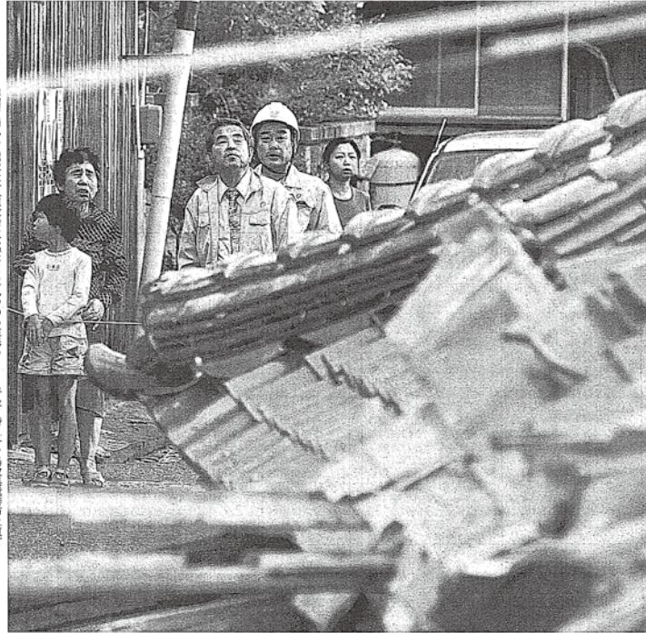
余震で揺れる鳥取市東部教会。不安定な土壌で、6日後、約6分、鳥取県境津市道町