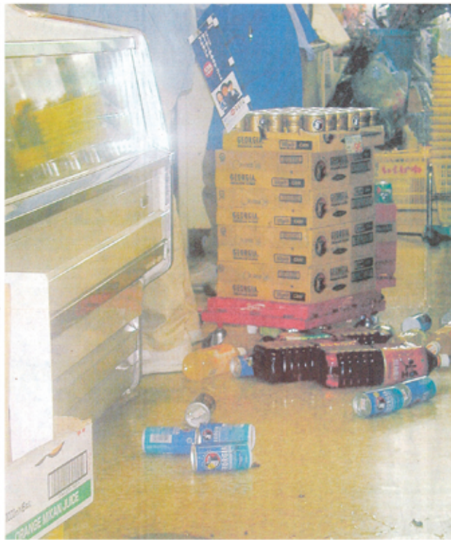
地震で商品が散らした米子市内のスーパー