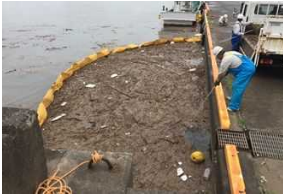
漂着物の状況（鳥取港）

令和3年7月豪雨により、泊地（港湾内）及び海岸に流木等が大量に漂着し、船舶の入出港が困難となったため、漂着物を緊急的に撤去し、船舶の入出港の確保や海岸環境の保全を図る。