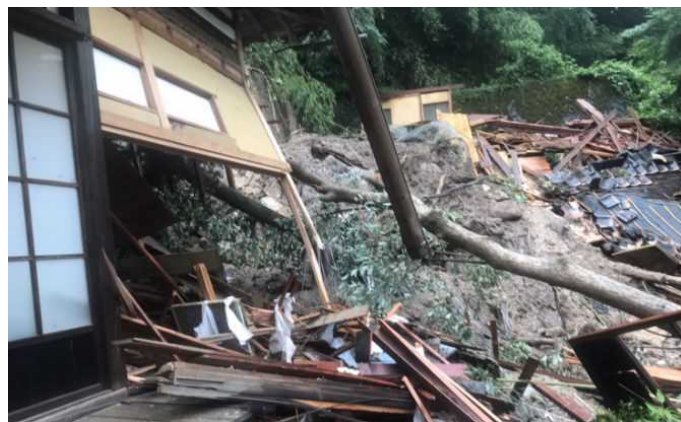
三朝町山田地区（南苑寺）