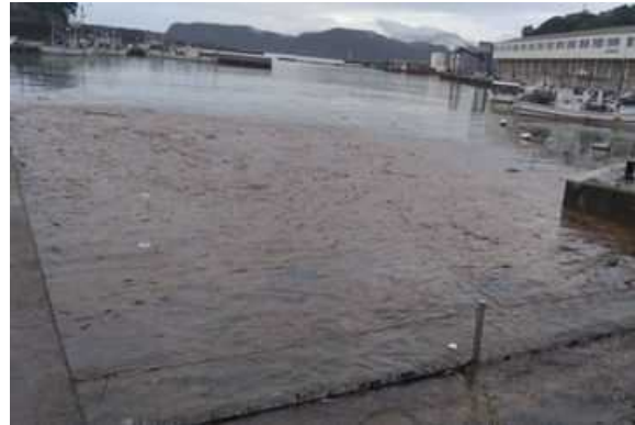
漂着物の状況（田後港）