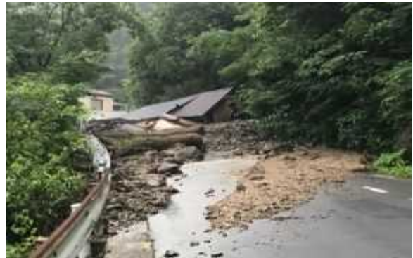
県道鳥取鹿野倉吉線（三朝町三徳）土砂流出