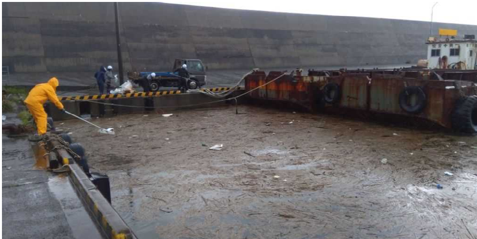
漂着物の状況（網代漁港）

令和3年7月豪雨により、泊地（漁港内）及び海岸に流木等が大量に漂着し、船舶の入出港が困難となったため、漂着物を緊急的に撤去し、船舶の入出港の確保や海岸環境の保全を図る。