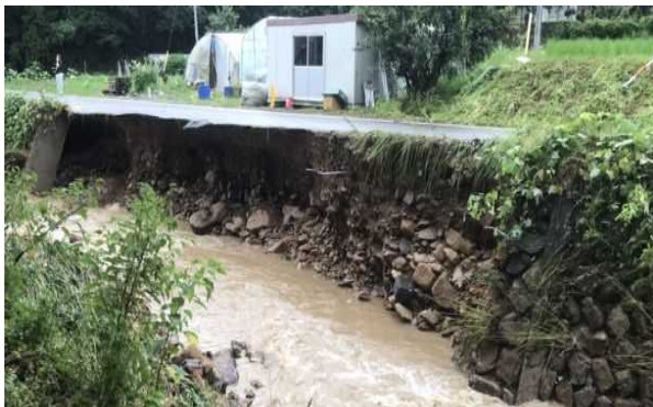
富海川（倉吉市富海）護岸崩落