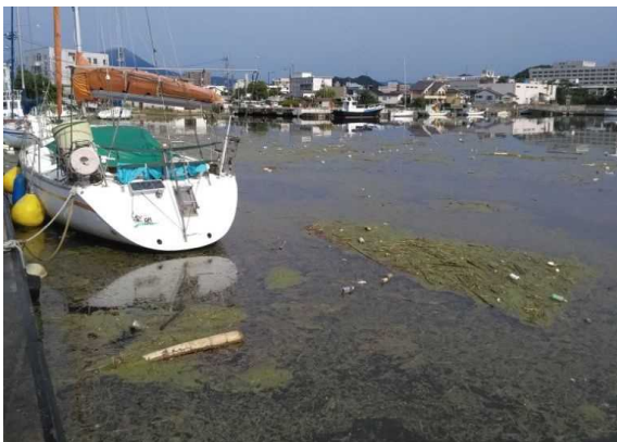
漂着物の状況（米子港）