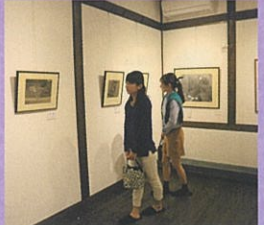
問/塩谷定好写真記念館 ☎0858-55-0120 D-2