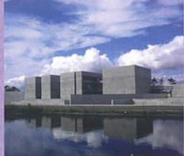
問/植田正治写真美術館 ☎0859-39-8000 C-3

海外では「Ueda-cho(植田調)」とも称される、被写体をオブジェのように配置した独特の技法で有名な世界的写真家・植田正治氏の写真館。高松伸氏の設計による個性的なコンクリートの外観は、植田の代表作「少女四態」を模しています。