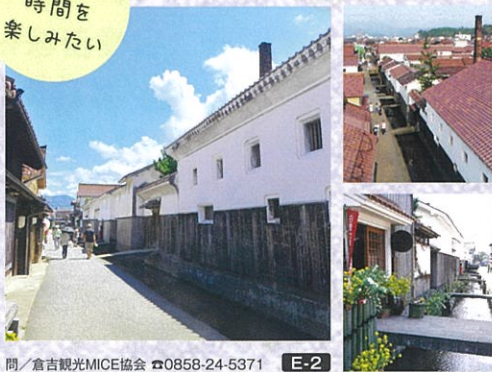
問/倉吉観光MICE協会 ☎0858-24-5371 E-2

白壁土蔵群は、明治、江戸期に建てられたものが多く、今でも当時の面影を見ることができ、国の重要伝統的建造物群保存地区に指定されています。白い漆喰壁に黒の焼き板葺、屋根には赤い石州瓦、かつて造り酒屋や醤油屋だった建物が、今では博物館や喫茶店などで利用され、伝統とレトロな魅力に出会う散策ができます。