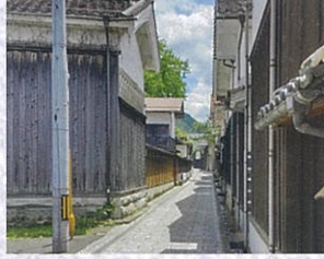
問/若桜町観光協会 ☎0858-82-2237 H-3

かつて鳥取と播州を結ぶ宿場町であり、今も旧家の白壁土蔵の通りが残っています。情緒ある散歩道として親しまれています。