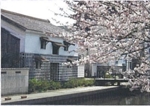
問/米子市観光協会 ☎0859-37-2311 B-2