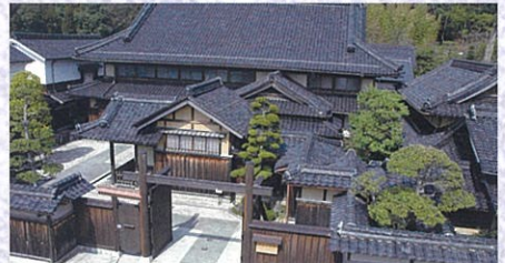
問/智頭町観光協会 ☎0858-76-1111 G-4