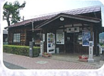
↑ライダーの聖地「隼駅」