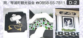
問/琴浦町観光協会 ☎0858-55-7811 D-2

光集落の家々や蔵には、地元の左官職人が漆喰壁に鍔で描いた福神や動植物の浮き彫り(鍔絵)が多く施されています。絵画的、装飾的に施された鍔絵のある家が密集している全国的にも珍しい場所です。