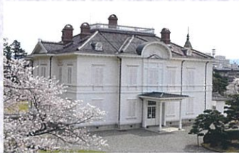
問/鳥取市観光コンベンション協会 ☎0857-26-0756 G-2