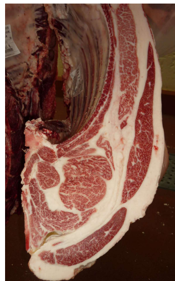
雌(美照清×百合茂×安福久) BMSNo.11, ロ-入芯80cm