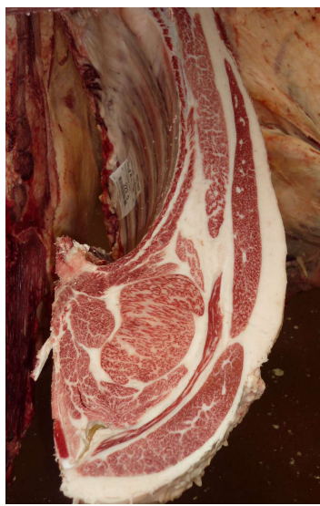
雌(美照清×福増×安福久) BMSNo.11, ロ-入芯85cm