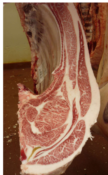
去勢(美照清×美国桜×白鵬85の3) BMSNo.11, ロ-入芯80cm