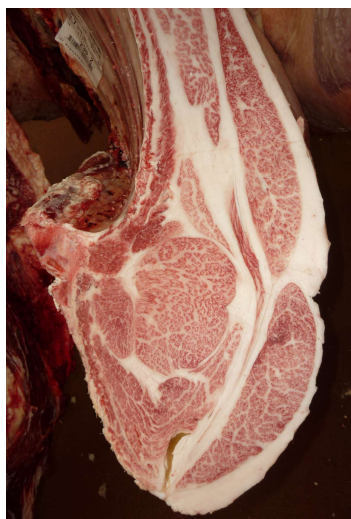
去勢(美照清×美国桜×安福久) BMSNo.12, ロ-入芯80cm