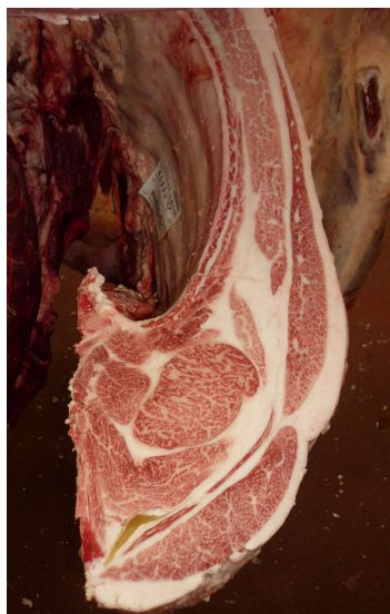
去勢(美照清×美津照重×安福久) BMSNo.11, ロ-入芯67cm