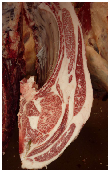
雌(美照清×白鵬85の3×百合茂) BMSNo.10, ロ-入芯69cm