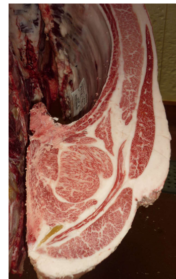
去勢(美照清×白清85の3×平茂勝) BMSNo.12, ロ-入芯84cm