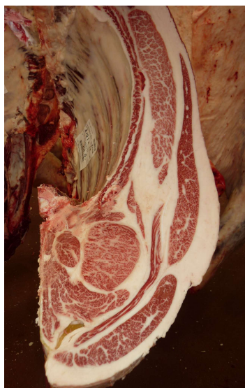
去勢(美照清×白鵬85の3×安福165の9) BMSNo.12, ロ-入芯68cm