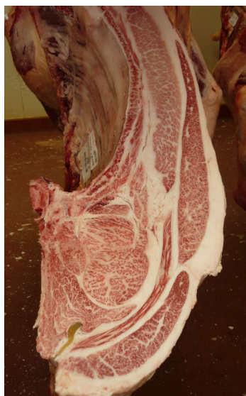
去勢(美照清×美国桜×安福久) BMSNo.12, ロ-入芯95cm