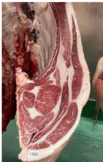
雌(美照清×百合福久×美津照重) BMSNo.6, ロ-入芯58cm