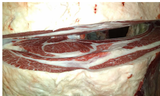
去勢(美照清×秀正美×平茂勝) BMSNo.6, ロ-入芯74cm