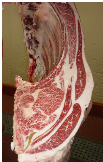
雌(美照清×安茂勝×第1花国) BMSNo.7, ロ-入芯48cm