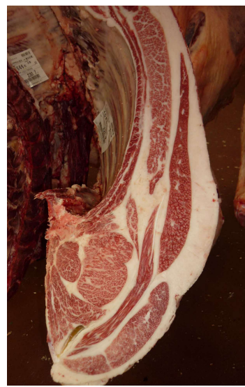
雌(美照清×百合白清2×安福久) BMSNo.10, ロ-入芯68cm