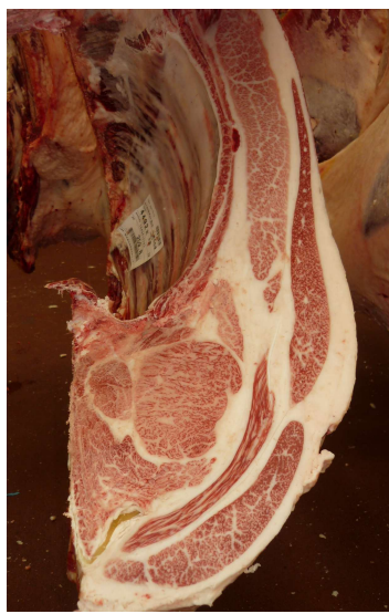
去勢(美照清×白鵬85の3×茂洋) BMSNo.12, ロ-入芯92cm