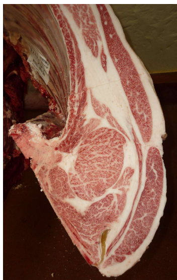
去勢(美照清×幸紀雄×安福久) BMSNo.12, ロ-入芯76cm