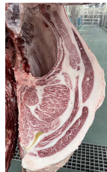
雌(美照清×白鵬85の3×百合茂) BMSNo.11, ロ-入芯91cm