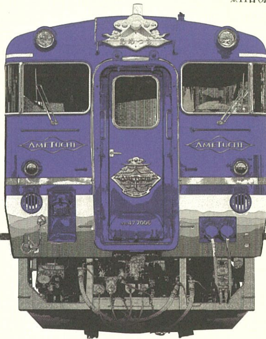
2018年~現在「あめつち」キハ47形