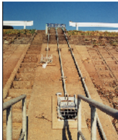
↑ ハンドルで操作する斜樋