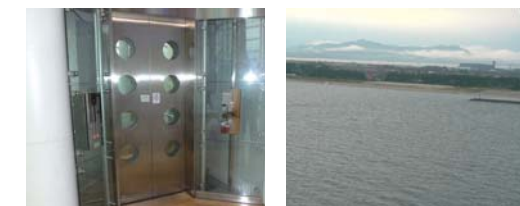
エレベーターで展望台へ 遠く大山が望めます

1997年に開催されたジャパンエキスポ97鳥取「山陰・夢みなと博覧会」のシンボルタワーとして建設されました。展望タワーからは大山、中海、島根半島、美保湾など360度のパノラマを楽しむことができます。